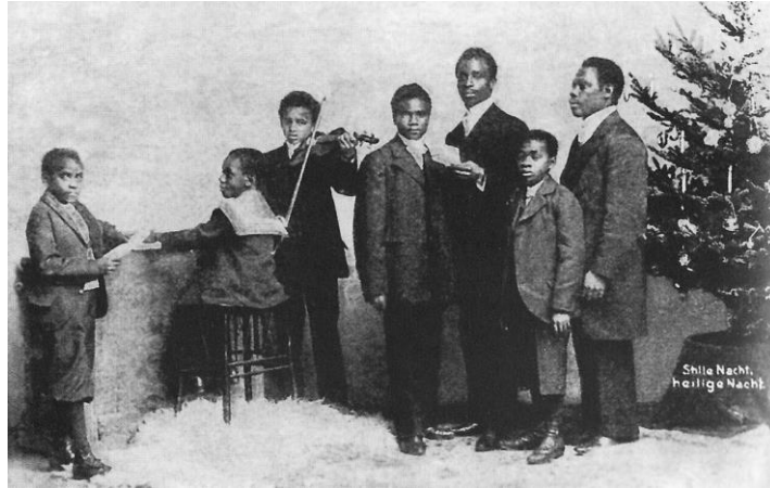
Vor 121 Jahren im Deutschen Kolonialhaus in Berlin 1