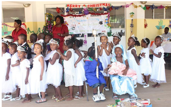
verfrühtes Weihnachtsfest in einem Kindergarten in Harare, Simbabwe oder

Als Maßstab verwende ich das althergebrachte Bruttoinlandsprodukt, aber in zwei verschiedenen Ausprägungen: für die Marktgröße das nominelle, zwecks Vergleichbarkeit zu laufenden Wechselkursen in USD umgerechnet; für die durchschnittliche Möglichkeit, Geschenke zu kaufen, hingegen das BIP zu Kaufkraftparitäten: Da geht es ja darum, was für den Luxus von Weihnachtsgeschenken übrigbleibt nach dem Besorgen des Lebensnotwendigen.