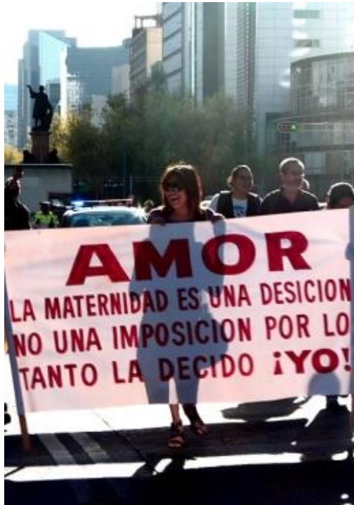
Geliebter: Zur Mutterschaft braucht es eine freie Entscheidung, keinen Zwang – und entscheiden tue ich! 19