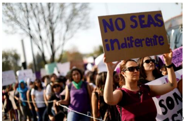
Bleib' nicht gleichgültig!

Wie in Frankreich damals schrillen jedenfalls auch unter den US-RepublikanerInnen heute die Alarmglocken nicht oder zumindest nicht laut genug. Müssen wir auf eine neue Simone Veil hoffen? Diese gaullistische, also konservative Politikerin 29 hatte in ihrer Zeit als Gesundheitsministerin einen großen, wenn nicht wesentlichen Anteil am Gesetz zur Fristenregelung vom 17.1.1975 – also ein Vierteljahrhundert nach der Veröffentlichung von Beauvoirs Zweitem Geschlecht. Loi Veil , also Veil-Gesetz wird ihr zu Ehren diese Legalisierung des Schwangerschaftsabbruchs durch das französische Parlament oft genannt. Was für ein Segen für die Französisinnen (und auch ihre Männer oder Liebhaber)!