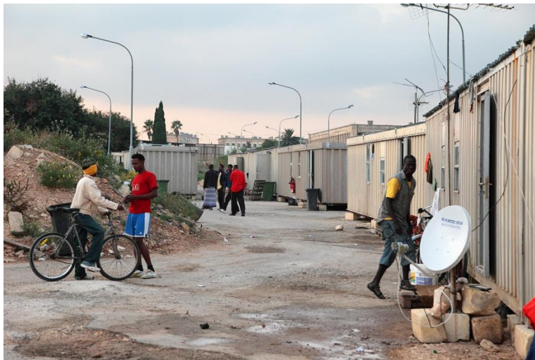
Hal Far, Malta, offenes Zentrum für Flüchtlinge 15

Was den Prozess der Entscheidung betrifft, spielt sicher die Persönlichkeit eine wichtige Rolle. Generell sollen Menschen, was die Zukunft betrifft, zu optimistisch sein 14 . Stimmt das, dann wären die aus dem kognitiven Migrieren hervorgehenden Entscheidungen zu oft pro-Migration. Angst kann ein guter Ratgeber sein – schon bei kleinen Kindern heißt es ja, dass die zögerlichen, die vorsichtigen die klügsten sind – weil sie sich die Gefahr am besten vorstellen können.