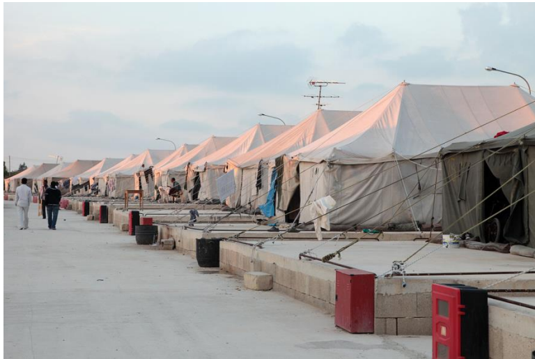
Hal Far, Malta, offenes Zentrum für Flüchtlinge 5

Nur wenn es sich um Flucht handelt, passiert Migrieren von heute auf morgen. Sonst geht dem eigentlichen Akt, also dem Aufbruch, eine je nach Person und Umständen kürzere oder längere Vorbereitungszeit voraus, in der vorausblickendes Imaginieren und mentales Simulieren die heranreifende Entscheidung begleiten.