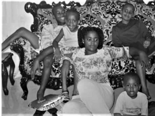
von ihren Kindern umringte Mutter, Nigeria 1