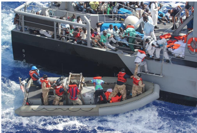
aus Seenot Gerettete werden vom amphibischen Transportdock-Schiff USS San Antonio (LPD 17) auf das Küstenpatrouillenboot P52 der maltesischen Streitkräfte transferiert 6

Auch wenn in solchen Situationen die Informationslage nie perfekt ist und wenn auch nur selten auf exakten Prozentsätzen von Wahrscheinlichkeiten basierende Berechnungen erwarteter Ergebnisse angestellt werden, so ist doch jedenfalls davon auszugehen, dass in der ganz überwiegenden Zahl auch der riskantesten Migrationen die Gefahr bewusst eingegangen wird. Und ebenso, dass den allermeisten klar ist, dass auf der anderen Seite kein Eldorado, sondern ein hartes und in vieler Hinsicht entbehrungsreiches EmigrantInnen-Leben wartet.