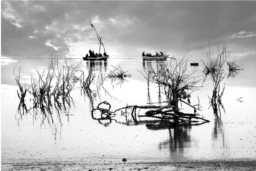
Qarun-See, südwestlich von Kairo – wichtiger Ort für eine andere Art von Migration: die von Zugvögeln (migratory birds) 12

Kyle & Koikkalainen unterscheiden drei Etappen oder “Migrations-Momente“: Auf das Bewusstwerden der persönlichen Möglichkeit des Migrierens folgt die kognitive Migration, bevor es zur Entscheidung kommt, ob oder ob nicht migriert wird 11 .