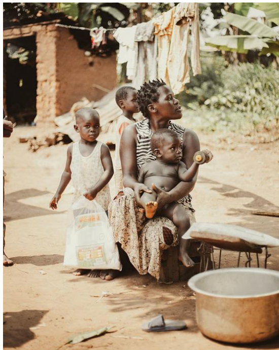
Mutter mit Kindern, Uganda 18

Zum Abschluss ein Foto, das einem "kognitiv Immobilisierten" leicht als Sehnsuchtssubstrat dienen könnte.